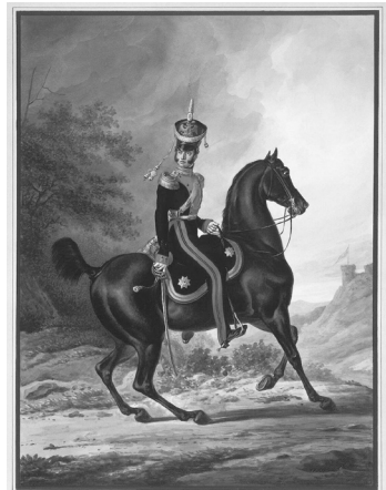
Štábní důstojník ruských husarů.

Roku 1805 dne 27. september začalo se tažení ruského pomocného vojska, 80.000 proti Francouzům skrze Moravu. Dne 2. october museli jet z Boskovic na