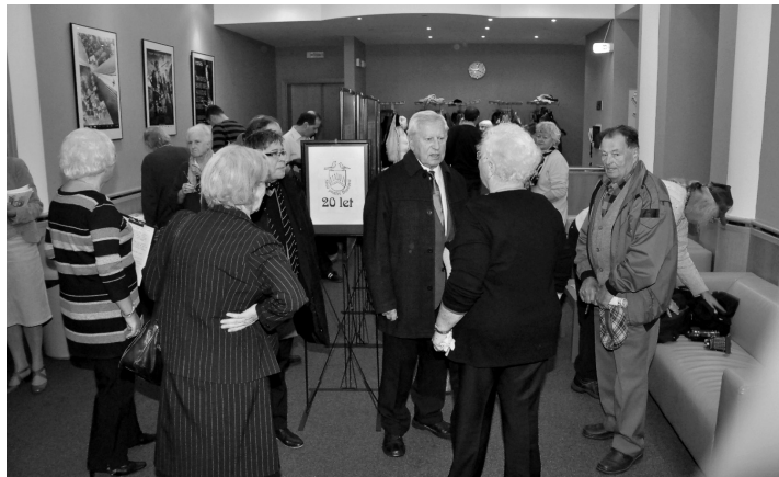
V přísálí kina Panorama před zahájením oslav.