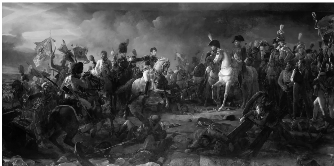
Obraz bitvy u Slavkova. François-Pascal Simon, baron Gérard – La bataille d'Austerlitz. 2. decembre 1805.

Nejčastější příčinou úmrtí byly úplavice či střevní úplavice, vysilení, břišní tyfus, plicní TBC a vodnatelnost. Údaje na desce jsou převzaty z boskovické matriky, tak jak byly zapsány v letech 1813 a 1814.