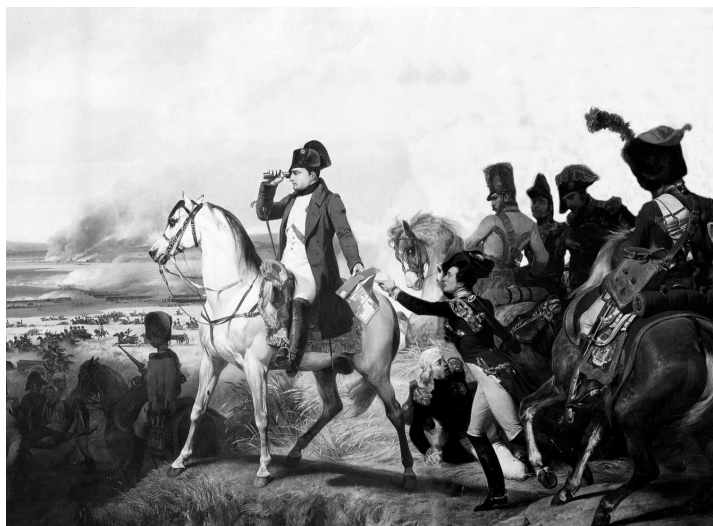
Napoleon Bonaparte vede své vojsko do bitvy u Wagramu.

svitávského pudmistra. Nechtěli jich pustit, až jim boskovská vrchnost a mněsto, spolu i židí, museli složit 6000 zlatých a Svitávka 3000 zlatých. Museli je ještě v noci zanést do Letovic.