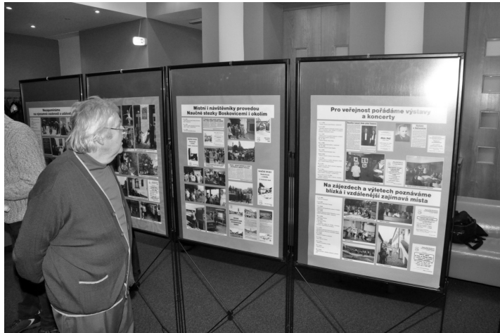
Výstava připomenula všechny akce Klubu přátel od jeho založení.