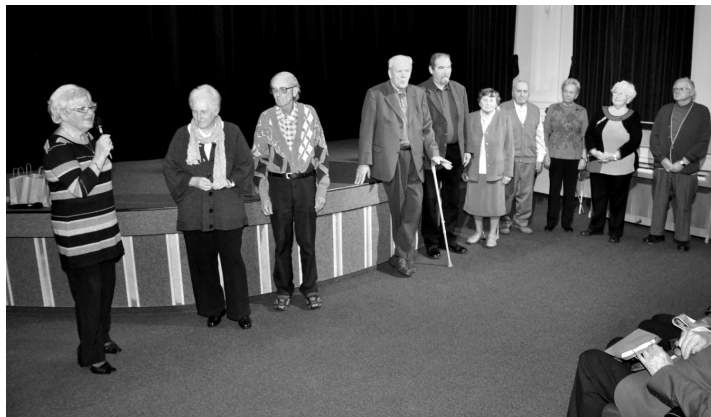
Zakládající členové Klubu přátel Boskovic převzali pamětní listy a plakety.