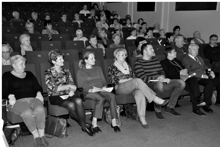
Zahájení se zúčastnilo i celé vedení města Boskovic.