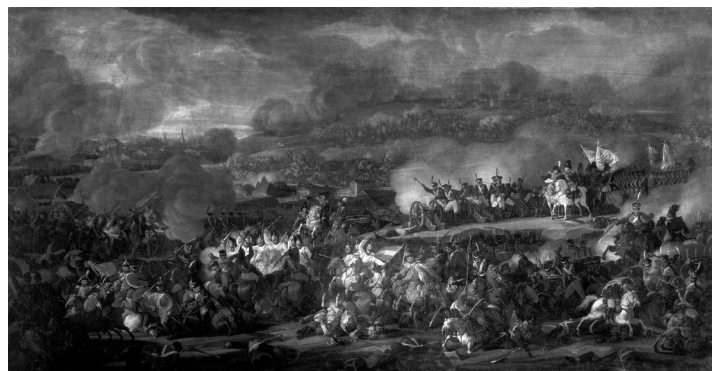
Bitva u Lipska - obraz Vladimíra Moskova z roku 1815.

Dně 1. listopadu , menovitě na den Všech svatých, o 6 hodinách ráno odmaširovaly z Boskovic škadrona šašerů fran-