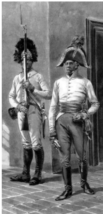
Granátník (příslušník infanterie) a generálmajor rakouské armády v roce 1809.

1805 dně 8. prosince na den Početi Panny Marie, o sedmi hodinách večír přijelo sem do Boskovic 55 mužů, Francouzů, z Opatovic. Mněli s sebou jednoho francouzského plezirovaného ( raněného ) oficíra. Zůstali přiz ( přes ) noc v Boskovicích, druhý den ráno vekslovali ( vyměňovali ) jim židí dukáty ( dukát = zlatá mince; 1 dukát = 3 zlaté 10 krejcarů ). Začali jim Francouzi dávat za jeden dukát po 10 rénských bankocetle ( papírové peníze ). Až napoleony snesli jim židí sto kusů dukátů; dali