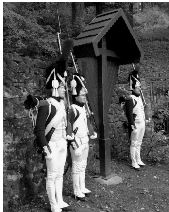
Kříž za boskovickým zámekem.

Článek by nevznikl bez významné pomoci Státního okresního archivu Blansko.