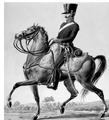
Šašer - francouzský jízdní myslivce - le chasseur à cheval.

Roku 1813 vpadli Francouzi do ruské zemně. Přišli až do Moškvje, mněsta hlavního. Však ale k svému velkému neštěstí přišla na ně tam nesnesitelná zima, tak že jich tolik tisíc pomrzlo, ostatní museli na spátek retererovat. A zasi s těch mnoho tisíc dílem do smrti zmrzli a dílem