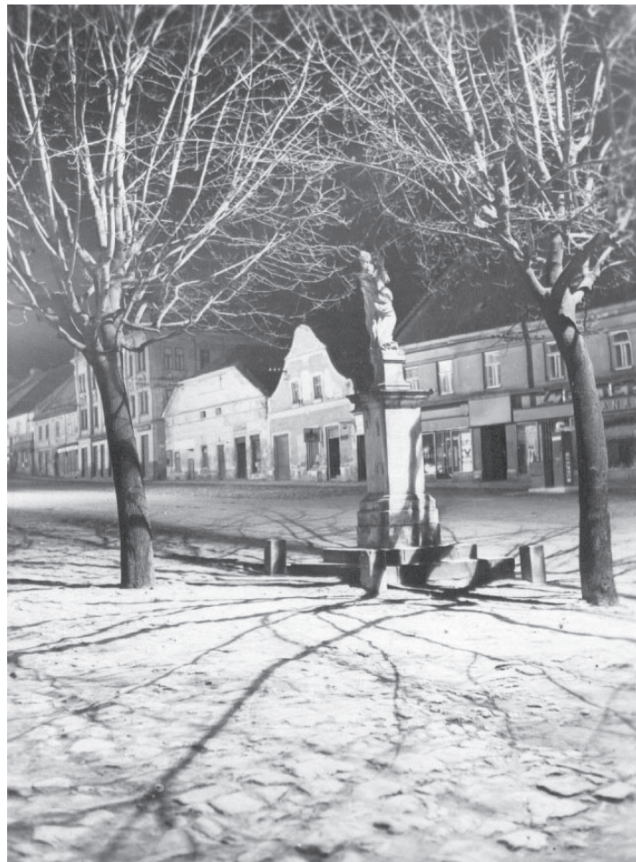
Centrální část boskovického náměstí. Pohlednice z 30. let 20. století.

Až zase rozsvítíme světlo, nebo zapneme televizi, dbejme na to, aby ta záplava umělého světla a zábavy nepřehlušila vnitřní světlo radosti a naděje. Přejí vám, ať vás cestou adventem a vánočními provází pokoj a radost z krásných setkání.