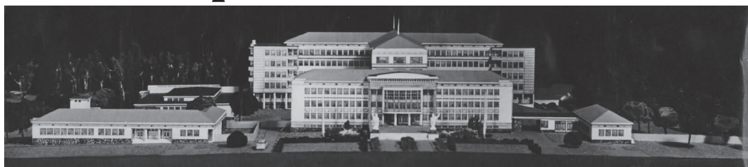
Maketa boskovické nemocnice s poliklinikou.

Zdraví, to je to nejcennější, co každý z nás máme. Proto bylo velkou snahou boskovických občanů, vybudovat ve městě nemocnici, která by poskytovala zdravotnické služby celému regionu a nebylo nutné jezdit za lékařskou péčí do zdravotnických zařízení v Brně.